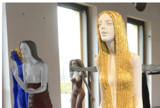
Obrázek 4 jedno z dalších děl Olbrama Zoubka