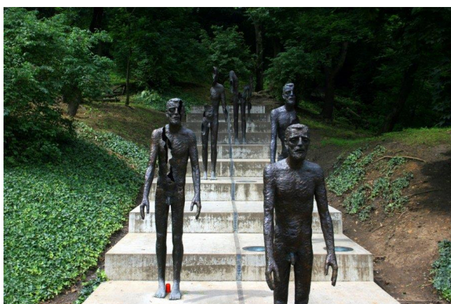
Obrázek 3 Pomník obětem komunismu