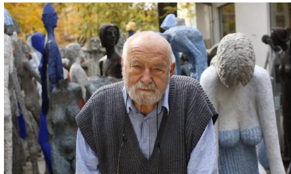
Obrázek 2 Olbram Zoubek

Zoubkův styl je velmi osobitý, je charakteristický například výraznou vertikálností nebo rozrušeným povrchem. V letech 1974–1991 se také zabýval restaurováním, jelikož nemohl kvůli režimu sám vystavovat.