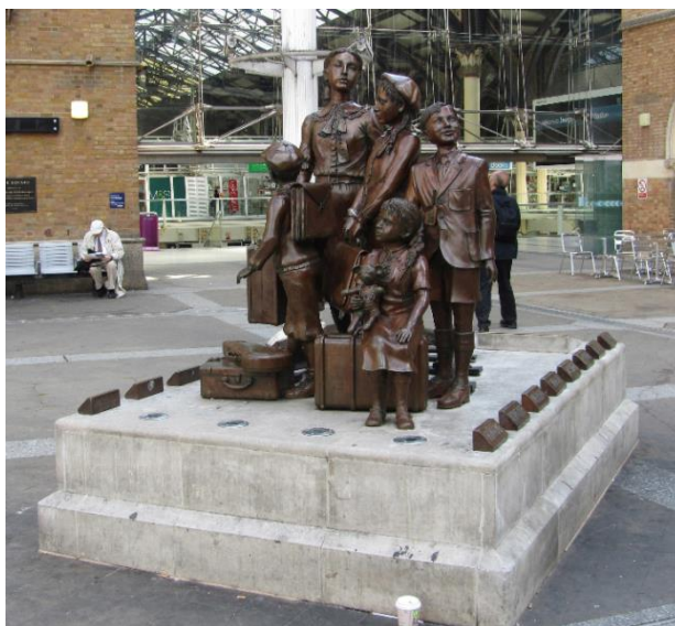
Obrázek 7: Meisler sculpture