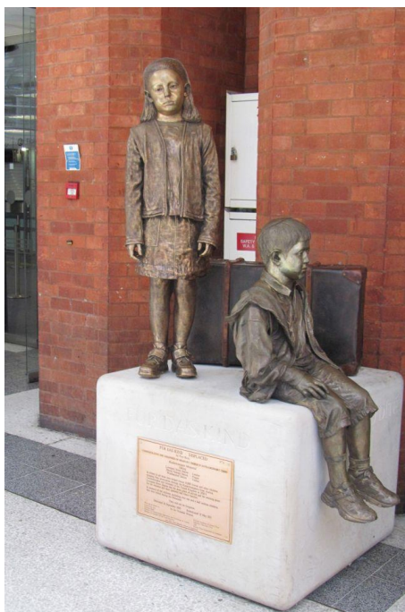
Obrázek 6: Fur das Kind