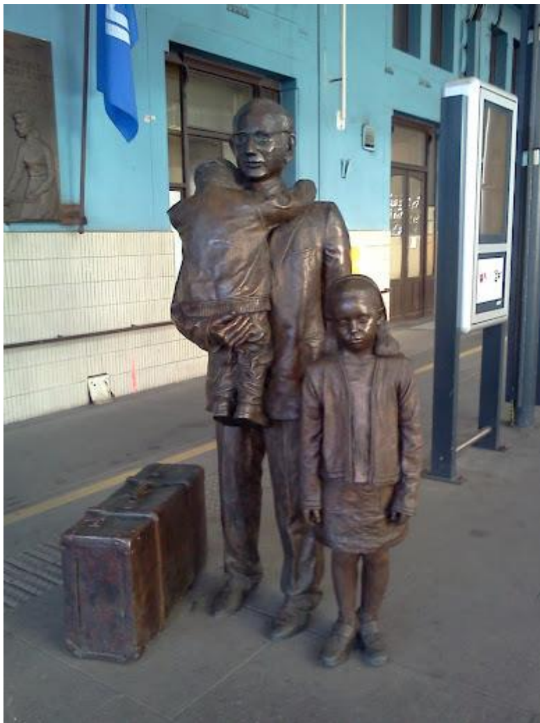
Obrázek 2:socha Nicholase Wintona a dětí

Sousoší se skládá ze tří postav, které jsou vymodelovány podle skutečné podoby – sira Nicholase Wintona, vnučku jednoho ze zachráněných dětí a chlapce, který se podobá tříletému Hansimu, jenž přijel posledním vlakem do Anglie, bohužel po několika dnech zemřel.