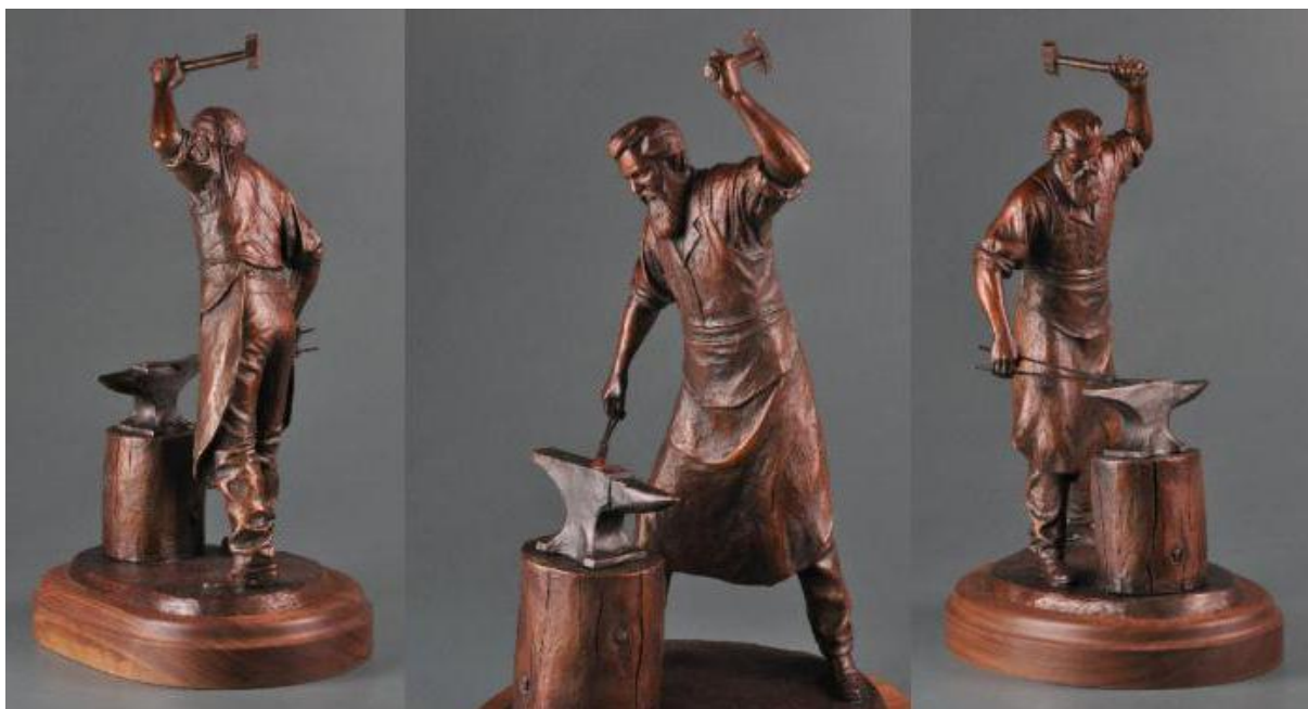
Obrázek 8 Soška kováře z bronzu

Bohužel jsem nedohledal přímo zdroje, který by uváděly, jaký přesně materiál byl k výrobě sochy použit, ale díky bohaté tvorbě autorky, jde usoudit, že se jedná o slitinu kovu (pravděpodobně o bronz). Tento materiál je vidět u dalších soch, jako např. Friedrichstrasse side with flowers.