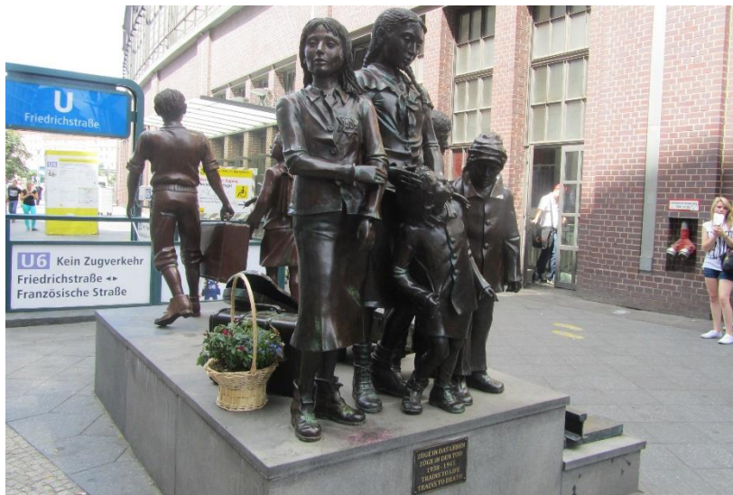
Obrázek 5: Friedrichstrasse side with flowers