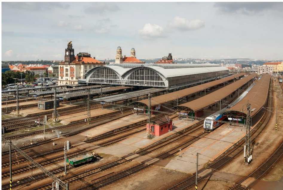
Obrázek 4: Hlavní nádraží v Praze