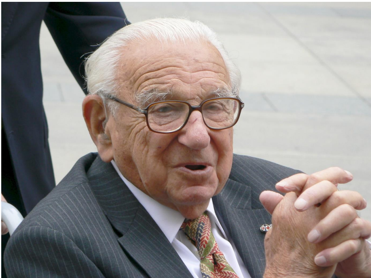
Obrázek 1: Sir Nicholas Winton

Nicholas Winton byl britský makléř a humanitární pracovník, který byl členem organizace BCRC ( British Committee for Refugees from Czechoslovakia ). Přímou se podílel v roce 1939 na záchraně 669 dětí převážně židovského původu z Protektorátu Čechy a Morava, před transportem do koncentračních, či vyhlazovacích táborů. A to tak, že jim zajistil odjezd vlakem z Prahy do Spojeného království a poté jim ve Velké Británii hledal rodiny, které by se o ně postaraly.